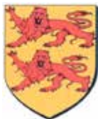
Commune de Saessolsheim